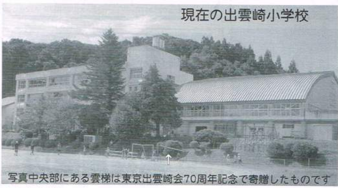
写真中央部にある雲梯は東京出雲崎会70周年記念で寄贈したものです