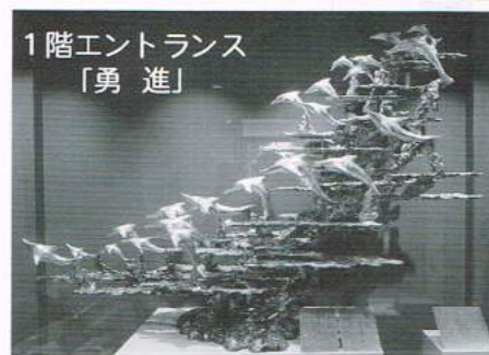
1階エントランス 「勇進」

状態の確認と紙面内容の打ち合わせが行われ、その後中止となった総会関連の取り組み等について協議、続いて会長任期満了に伴う件についても話され、コロナ禍の終息を願い、八十周年に向かい団結して行く事を誓い会議を終えました。