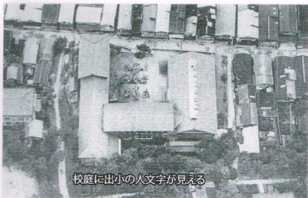
校庭に出雲小の人文字が見える